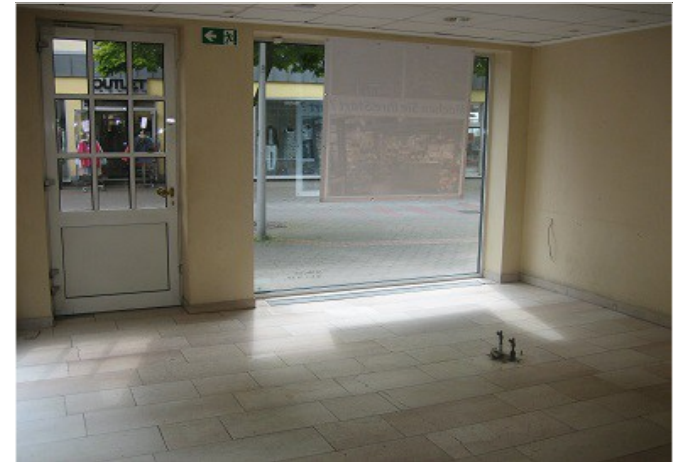
Ladenlokal - Eingangsbereich